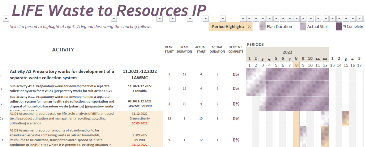
1.att. Ms Excel Ganta tabulas skats

Ganta tabulas aizpildīšanu nodrošina projekta vadošais partneris – Vides aizsardzības un reģionālās attīstības ministrija (turpmāk – VARAM), balstoties uz projekta partneru ceturkšņa atskaitēm un savstarpēji saskaņotu informāciju ar projekta partneriem.